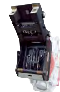
OILQUICK FÄSTEN Demarecs verktyg kan levereras med OilQuick-fästen efter kundens behov.