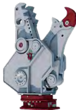
DL/DR-SERIEN Roterande pulveriserare/Crusher för primär/sekundär demolering. DemaPower-cylindern ger snabbare och starkare verktyg.

Alla Demarecs verktyg kan idag levereras med OilQuick-fästen färdigt från fabrik, efter kundens behov.