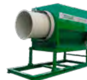
MS 3200 ST – Kapacitet 60 m 3 /h