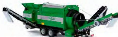
MS 5200 – Kapacitet 150 m 3 /h