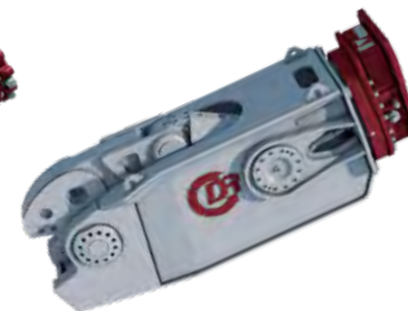
RC-30-SERIEN Rälsklipp med extrem kapacitet, hanterar de flesta förekommande rälsstyperna.