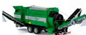
MS 3200 – Kapacitet 60 m 3 /h