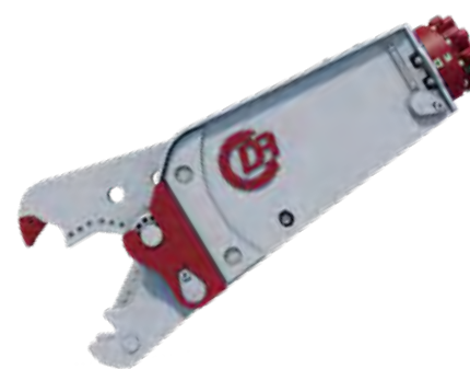
DMS-SERIEN Multi-Sax för mini-grävare. Armerad betong, skrot och kapning av kablar.