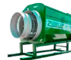
MS 5200 ST – Kapacitet 150 m 3 /h