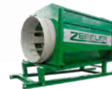
MS 4200 ST – Kapacitet 120 m 3 /h