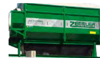
MS 6700 ST – Kapacitet 180 m 3 /h