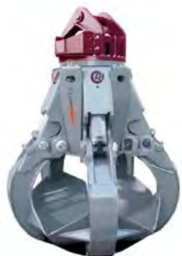
DPG-SERIEN Demarec Polygrip för hantering av bland annat skrot. För maskinvikter från 16-200 ton.