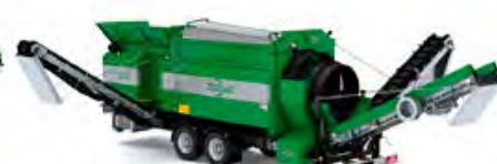
MS 4200 – Kapacitet 120 m 3 /h