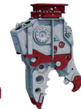
MQP-SERIEN Multi-quick kombi-verktyg för primär och sekundär demolering. 7 olika käftar.