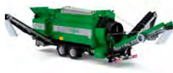
MS 1600 – Kapacitet 30 m 3 /h