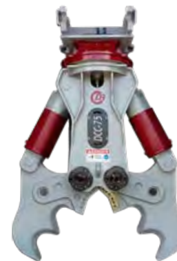
DCC-SERIEN 2-kolvs betongsax för kraftigt armerad betong. Exempelvis viadukter, kajer, fundament.