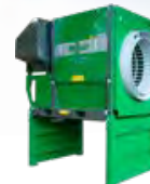
MS 1600 ST – Kapacitet 30 m 3 /h