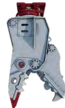
ECOLINE - DLP, DSP, DCC Ny serie från Demarec. Semiproffsredskap som ger mycket verktyg för pengarna.