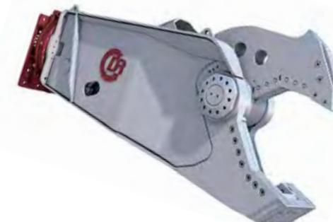
DRS/DXS-SERIEN Skrotsaxar med extremt hög klippkraft och optimal kapacitet i förhållande till vikt.