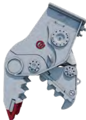
DSP-SERIEN Fast eller roterande pulveriserande för både primär och sekundär demolering/rivning.