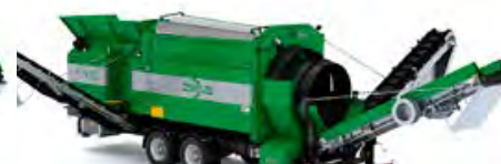
MS 6700 – Kapacitet 180 m 3 /h