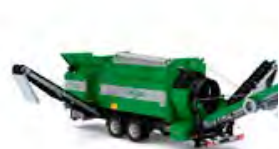
MS 1000 – Kapacitet 20 m 3 /h

Zemmlers Multi Screen möjliggör separation i 3 olika fraktioner i ett arbetssteg.