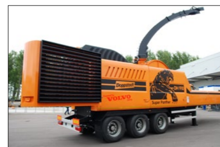
DH 910 VOLVO