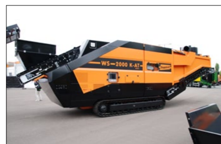
WS 2000 K-AT, Vindsikt