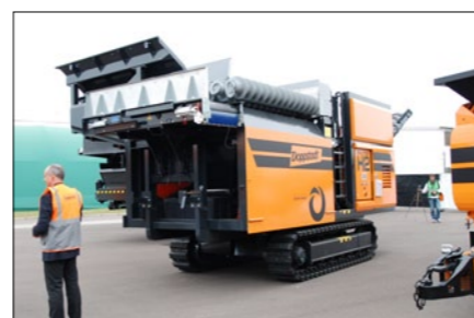
HS Splitter, grovsorterare