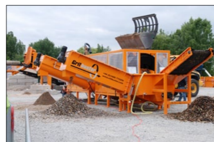
WT 250 Gritbuster, materialtvätt