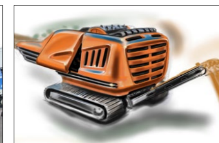
Framtiden! Universal Shredder lanseras 2017