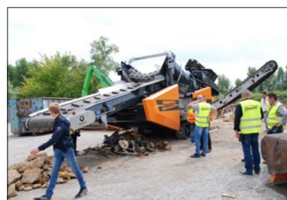
X2 Splitter, grovsorterare